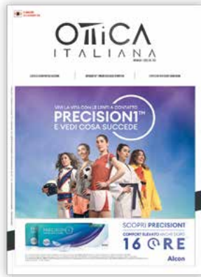
Ottica Italiana Mensile