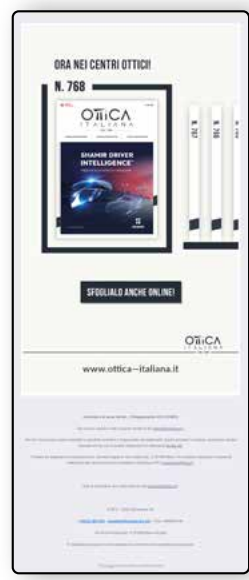
DEM Ottica Italiana