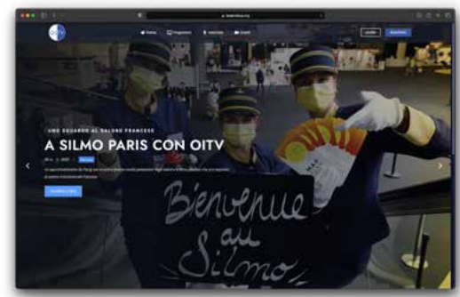
Ottica Italiana TV oitv.it + @OtticaltalianaTV su YouTube