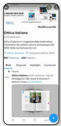
X 426 Follower