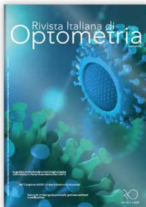
Rivista Italiana di Optometria Quadrimestrale