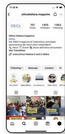
Instagram 1.875 Follower