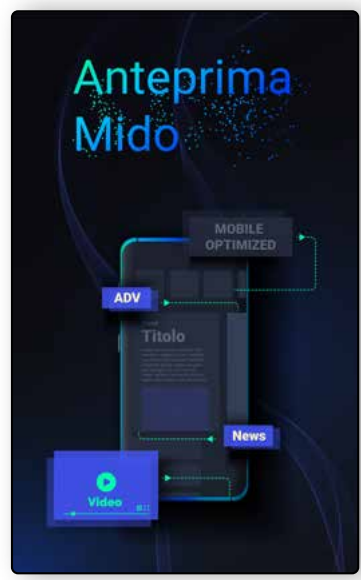
Anteprima Mido Digital