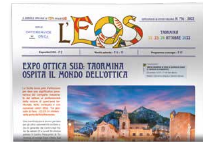
Il giornale di EOS Annuale