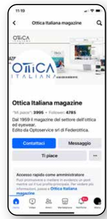
Facebook 4.785 Follower