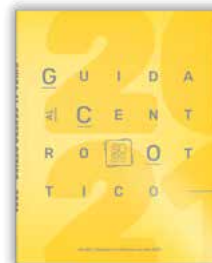
Guida al Centro Ottico Annuale