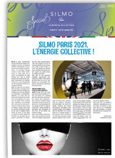
Spécial Silmo Quotidiano