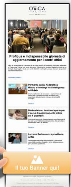
Newsletter Ottica Italiana