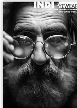
novità 2024 INDI-E Semestrale